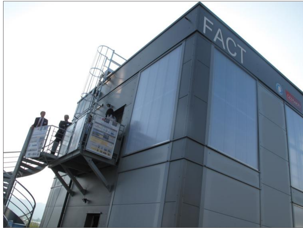
L'expérimentation grandeur nature sur la plateforme Fact permet de mesurer l'écart entre la performance énergétique d'un bâtiment prévue à la conception et sa consommation réelle.

« Cet équipement est à disposition des industriels